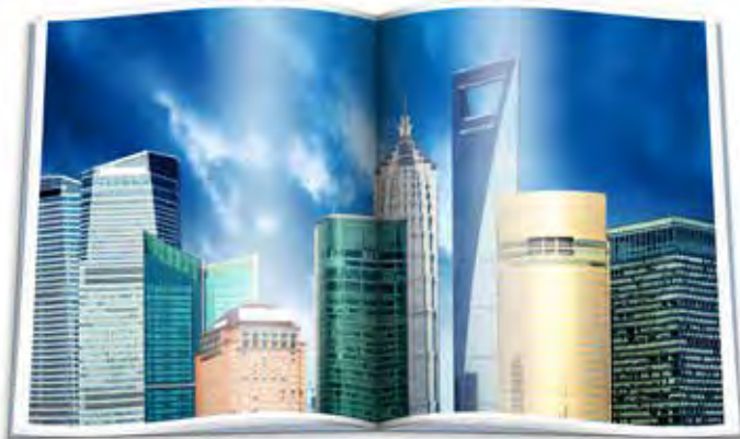
Eindrucksvolle Broschüren und Marketing Material