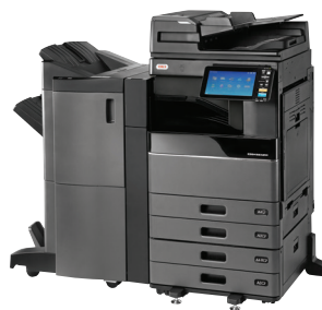
ES9466 MFP avec DSDF, PFP, module tiroir, module de finition piqûres à cheval et unité de perforation installés