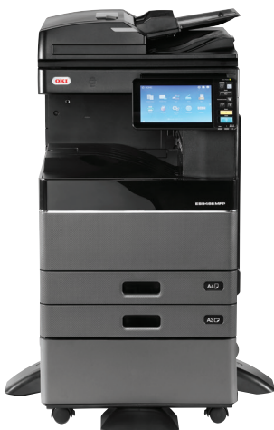
ES9466 MFP avec RADF et meuble