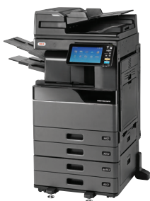
ES9466 MFP avec DSDF, PFP, module tiroir et module de finition interne installés