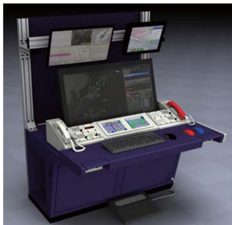
図1 新管制卓のイメージ図

従来から、OKIは管制卓システムを開発し、国土交通省航空局殿（以下、航空局殿）に納入、多くの空港や管制部で運用していただいている 1) 。今回、航空局殿の新仕様の制定に伴い、新たに管制卓システムを開発した。図1は管制官の使用する新管制卓のイメージ図である。