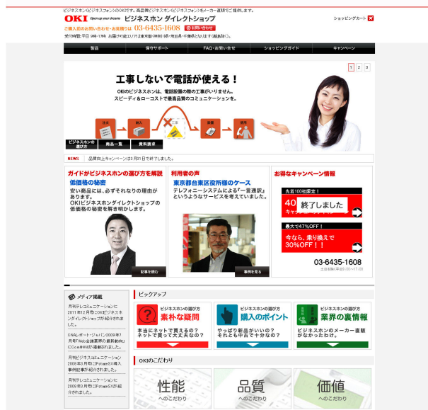
図1 ビジネスホンダイレクトショップ

そこでOKIは、近年のビジネストレンドである「ネット販売の事業化」とその実現に不可欠な販売協力パートナーとの「Win-Win体制の構築」、最新のマーケティング手法のイノベーションである「新カテゴリーの創造」の3つの視点に着目した。