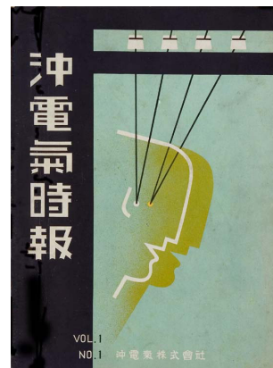
沖電気時報創刊号