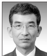
常務執行役員 株式会社OKIネットワークス 社長