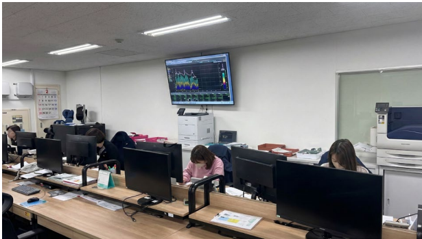
野田工場に設置されている 電力見える化のシステム画面

そうした状況の中で、今回の電力見える化パッケージ導入を担当したOKIから、電話やメールを通じて設定方法を一つひとつ丁寧にサポートいただき、大変助かりました。また、一般的に無線というと、『通信が途切れないか』『しっかり計測できるか』といった不安を持たれることもあるようですが、今回に関してはそういった問題は全く感じず、安定して運用できています。」