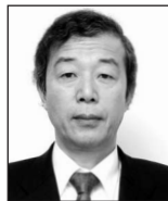
執行役員 ネットワークアプリケーション本部 本部長