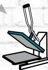
Transfert à chaud