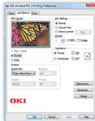
Interface du pilote