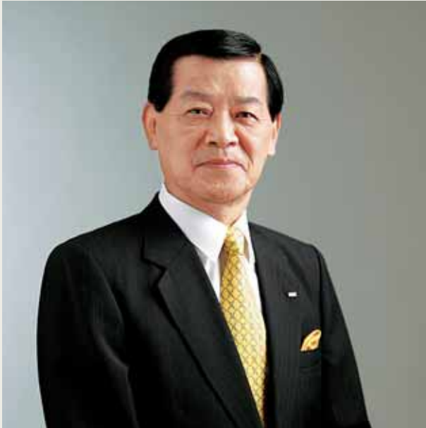
沖電気工業株式会社 取締役社長兼CEO

ユビキタスサービスに溢れた「e社会」の到来を見据え、 世界の人々の快適で心豊かな生活の実現に貢献してまいります。