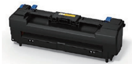
封筒専用定着器ユニット

OKIデータ(以下、ODC)は、封筒印刷のクオリティにこだわるお客様に向け、カラーLEDプリンター「MICROLINE VINCI」シリーズ用の「封筒専用定着器ユニット」を販売開始しました。