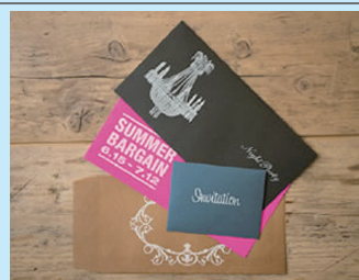
ホワイトやクリアーの デザイン性あふれるプリント印刷