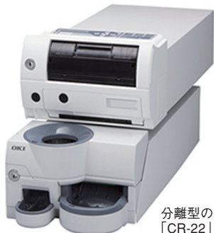
分離型の硬貨紙幣つり銭機「CR-22」

OKIは、食品スーパーや小売店舗向けの新商品として、人手不足への対応策として導入が進むセミセルフレジ *1 やフルセルフレジ *2 の精算機への搭載も可能な分離型の硬貨紙幣つり銭機「CR-22」の販売を開始しました。