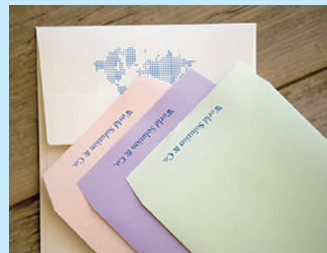
封筒デザインに求められる さまざまな出力対応