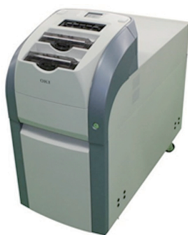
還流型紙幣入出金機「Teller Cash Recycler G7」

OKI Brasil(以下、OBR)は2016年12月までにブラジルの民間最大手であるブラデスコ銀行(Banco Bradesco)に還流型紙幣入出金機「Teller Cash Recycler G7」(以下「TG7」)を100台納入しました。今後ブラジル市場で、5年間で現金処理機4000台の販売を目指します。また、得意とする紙幣還流型商品のメリットを訴求し、ATMや現金処理機など関連商品の各国金融機関への販売を加速していきます。「TG7」はOKIがこれまで海外向けATMで培った技術とノウ