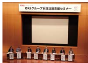
OKIグループ女性活躍支援セミナー (2016年12月)

2016年度の新卒採用者女性比率は27.6%と目標を達成。2017年5月には、女性の活躍推進に関する取り組みの実施状況などが優良であるとして、厚生労働大臣が定める「えらぼし」の認定を受けました。