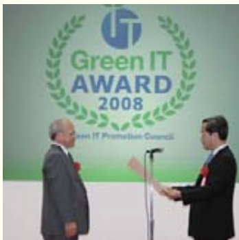
「グリーンITアワード2008」授賞式

OKIは、これらの技術開発にあたり、基礎研究は研究開発センター、商品開発は各事業部門と、効率的に機能分担しています。また、事業部門間での技術の交流を促進することで、事業部門をまたぐ新規技術・新規事業の創出も加速しています。要素技術の開発では、産学連携による研究も進めています。