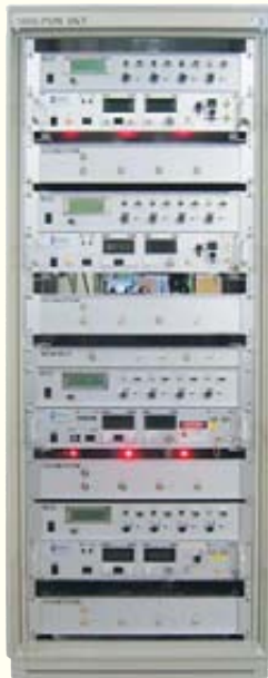
本システムの主要装置となるOLT (Optical Line Terminal)