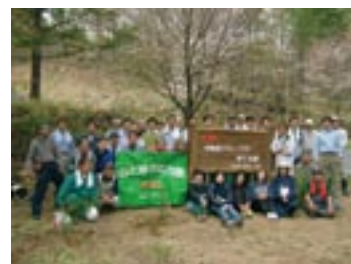
森林ボランティアの様子

2005年度は2001年度から継続している森林保護のためのボランティア活動を強化し、長野県小諸市の「沖電気グループが育てる森」をはじめ、グループの事業所がある各地で社員・家族が除伐・間伐を行いました。またNPO法人「ラオスのこども」による児童書の現地出版に、国際交流基金と共同でスポンサー協力しています。