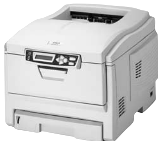
欧州向けカラーLEDプリンタ「C5300n」

カラーLEDプリンタシリーズは、全世界で数々の賞を獲得し、お客様にその機能・コストパフォーマンスを認知していただき、4月～6月(2003年2Q)のヨーロッパ市場でカラーページプリンタのシェア16%を獲得しました。また、US市場ではOffice Depot, Inc.、Comp USA Inc.の2大量販店と販売提携し、全米1,028店舗でカラーLEDプリンタの販売を開始しました。今年度カラーLEDプリンタを、全世界で昨年度250%増の20万台の販売を目指しております。