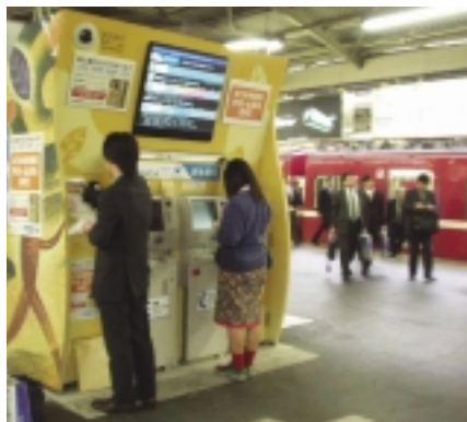
京浜急行品川駅に設置された省スペースATM「CP21V」

金融機関向け事業におきましては、全般的に金融機関の設備投資抑制の影響がありましたが、都市銀行の統合に伴う勘定系システムの統合や情報システムの再構築に向けた販売、地方銀行や信用金庫向けの次期営業店システムの販売およびコンビニなど流通向けの省スペースATM「CP21V」の販売などに注力した結果、比較的堅調に推移いたしました。また、ATMの生産拡大と中国市場での販売を目的に、中国広東省深圳市に「沖電気実業(深圳)有限公司」を2001年7月に設立し、10月よりATMの量産出荷を開始いたしました。