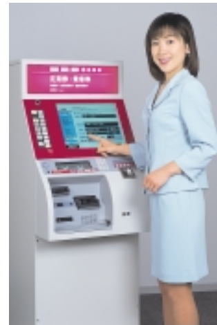
鉄道情報システム(株)と共同開発した「オンライン自動券売機」

政府が強力に推進しております電子政府の分野におきましては、省庁内文書管理・情報開示システムを納入し、また、電子自治体分野におきましては、ブロードバンド化をにらみ、「OKI MediaServer」を用いたテレビ会議や映像配信システムの販売に注力いたしました。