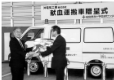
福島県赤十字血液センターでの献血運搬車贈呈式

●児童養護施設の子どもとボランティア参加者が一日親子になって遊ぶ「紙ひこうき大会」 ●絵本を殆ど読んだことのないラオスの子どもたちに絵本を送る活動「ラオス語絵本をつくってラオスの子どもたちに送ろう！」のイベント などボランティア活動のきっかけの場の提供およびインターネットを利用してのボランティア情報の配信を行っております。