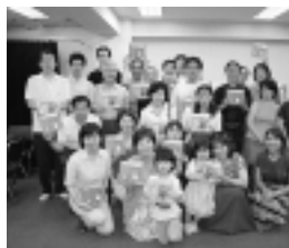
ラオス語絵本をつくってラオスの子どもたちに送ろう!