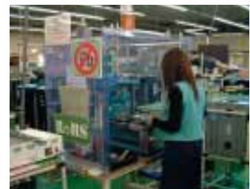
生産工程の識別・分離