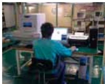
受入検査の蛍光X線分析

また、独自開発のリフロー加熱方式等により、大型・高多層基板に対しても高品質・高信頼性鉛フリーはんだ付け技術を提供します。