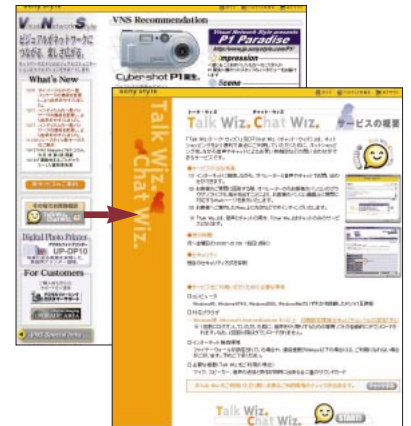
Talk Wiz.、Chat Wiz.の画面例