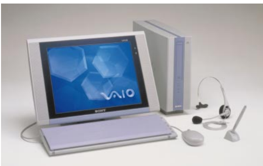
ソニースタイルオリジナル「パイオ」も発売

センターのオペレータと会話やチャット(文字による会話)でリアルタイムに買物相談などの問い合わせができるサービスである。