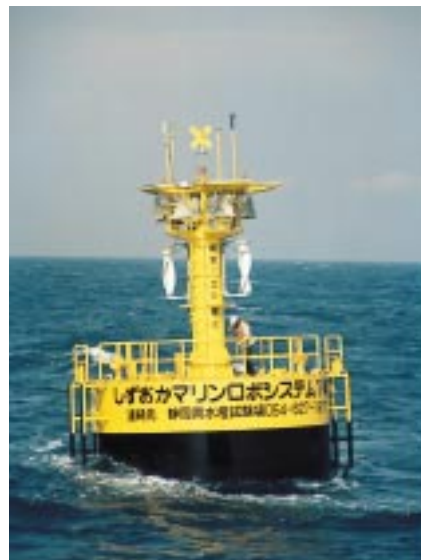
御前崎沖に浮かぶマリノロボット

「もともとは、豊かな自然に恵まれた駿河湾を高度に有効活用していく海洋牧场構想の一環として、集魚機能と