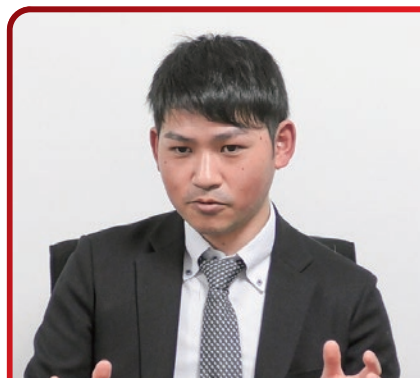
株式会社 Mujin 営業本部 名古屋営業部 アカウントマネージャー