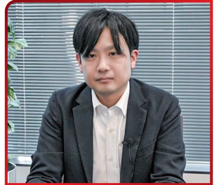
水戸工業株式会社 営業部 第8グループ グループ長

そして、今こうして無事稼働が始まったことは、大変嬉しく思っております。運用が進むにつれて新たなカスタマイズのご要望もあるかと思っておりますので、引き続き支援していきたいと考えています」。