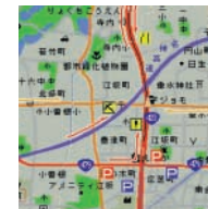
※表示画面はイメージです。

車両情報と共に交通情報を表示することにより、渋滞の状態をらくらくチェックできます。