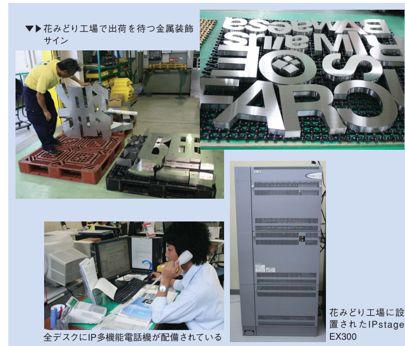
▼花みどり工場出荷を待つ金属装飾サイン

OKI 沖電気工業株式会社 〒108-8551 東京都港区芝浦4-10-16 TEL: 03-3454-2111 (代)