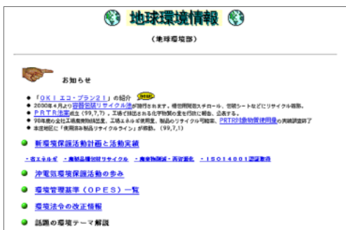
全社イントラネット