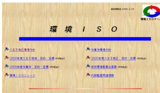
地区イントラネット