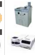
リテール 現金処理システム (出納機、釣銭機など)