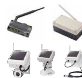
エッジデバイス 920MHz帯マルチホップ無線、 ゼロエナジー IoTシリーズ