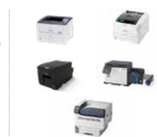
プリンター 各種モノクロ/カラープリンター、小型チケット・ ラベルプリンター/特色高速プリンターなど