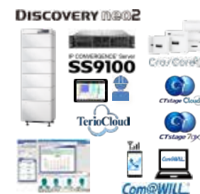
ビジネスコミュニケーション コンタクトセンター、PBX・ビジネスホン