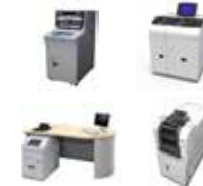
金融機関 営業店/事務集中システム (ATM、SmartCashStation、営業店端末、現金処理機など) Web・スマホアプリケーション ネットワークソリューション (映像監視、ネットワークセキュリティ)