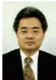
业务服务中心 工程部